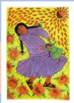
« L'amore per i suoi ragazzi »

Pitture di Guillermo Diaz, ATD Quarto Mondo, Perù. Ispirate da una ricerca condotta nei 5 continenti: "La violenza fatta ai più poveri, di quale pace siamo protagonisti?"