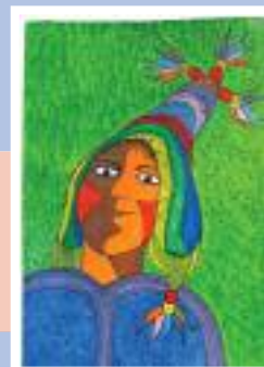
« Ci ignorano »