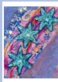
« Pioggia di stelle danzanti »