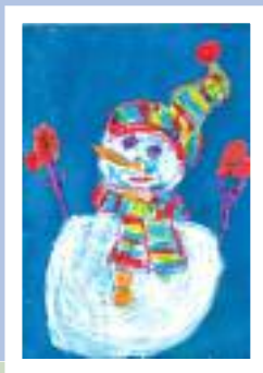
« Sorriso di nevic »