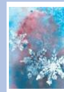
« Pioggia di stelle »