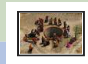
Donne ai pozzi nei India