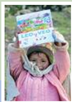
Cuyo Grande, Perù