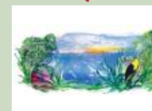
« Alba »