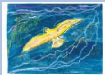
« Volo di pace »