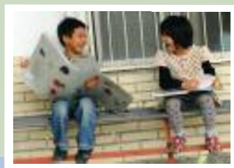
Hualien, Isola di Taiwan