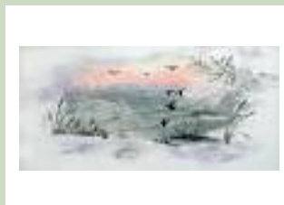
« Inverno »