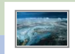
Ghiacciaio Folgefonn Norvegia