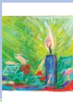
« Luce per la vita »