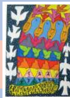
Metamorfosi per la pace